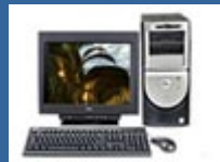
IBM PC Kompatible

Mac: System 7.0.1, 90 MHz, 3 MB RAM, 3 MB Festplattenplatz, 256 Farben,