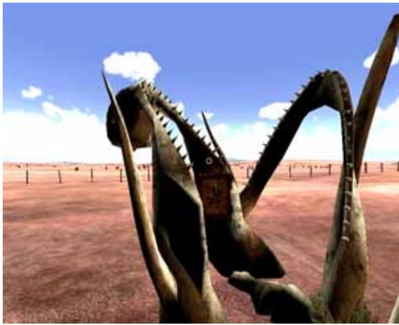
Tuch 1 , beim Skelett