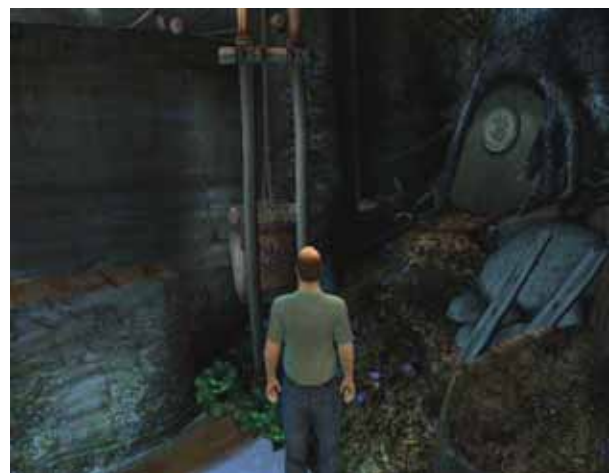
Tuch 5 , am Förderkorb

Nun geht's wieder zurück in die Wohnung.