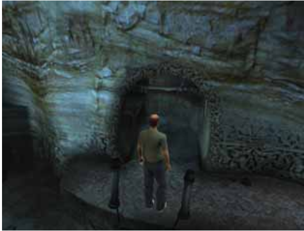
Tuch 4 , in der kleinen Höhle