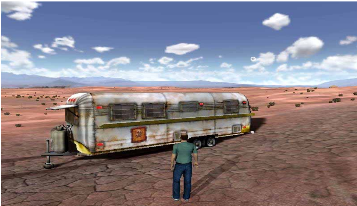
Tuch 3 , am Wohnwagen