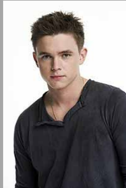
Jesse Mc Cartney

leihen, in der US Version, den beiden Brüdern ihre Stimme.