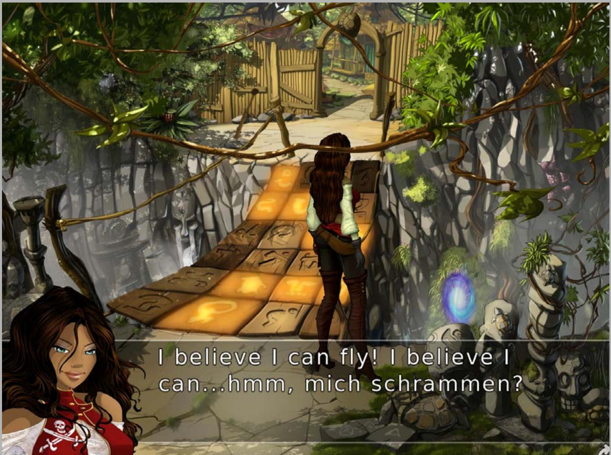
I believe I can fly! I believe I can...hmm, mich schrammen?